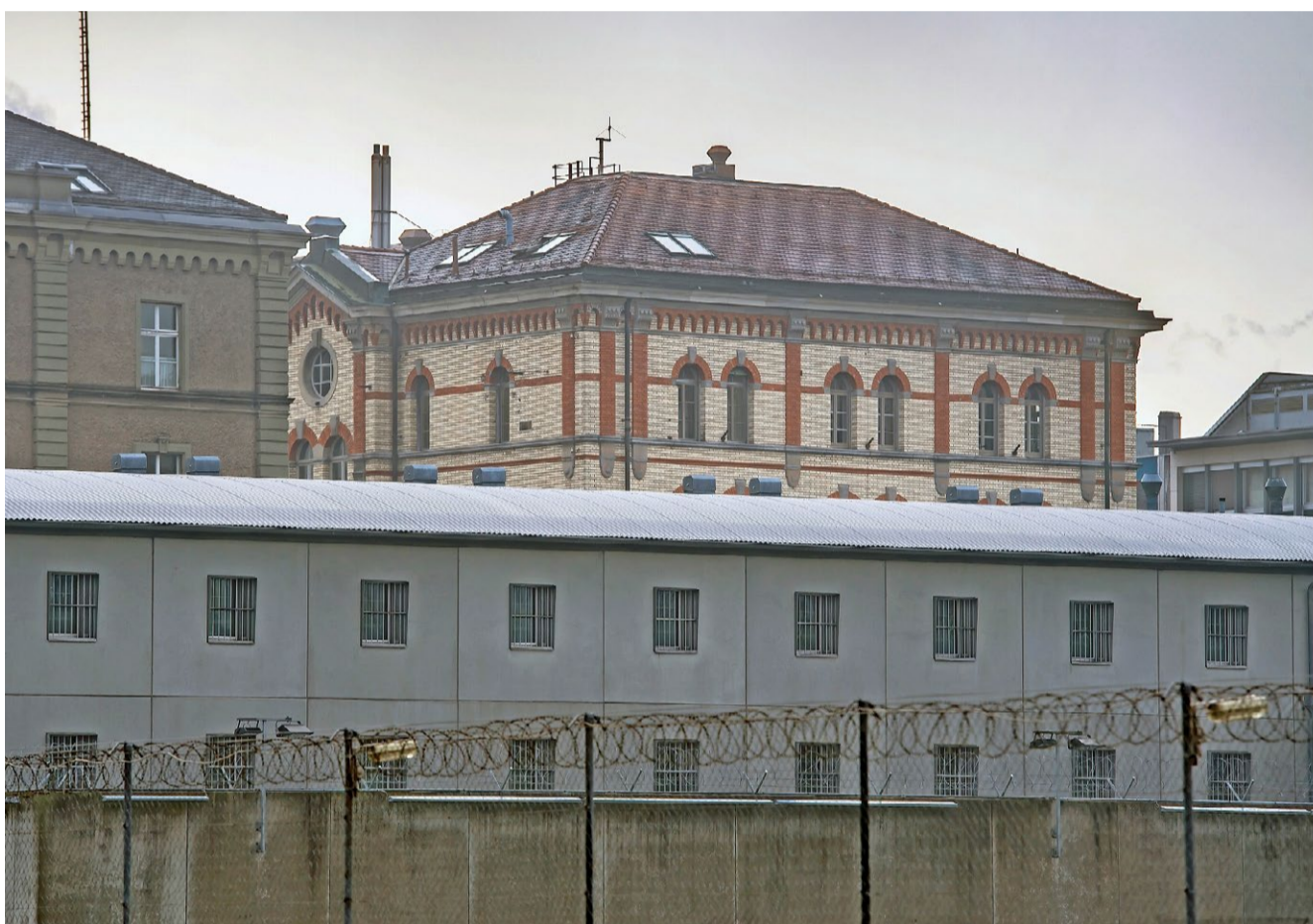
Viermal die Bewilligung verlängert: Das Zürcher Polizeigefängnis (vorne), errichtet 1994.

Es gibt dort zwar sechs Zellen, die ausdrücklich für Knaben vorgesehen sind, sowie zwei Zellen für Mädchen. Aus Sicht der Polizei genügt diese Trennung. Die NKVF ist anderer Meinung: Die «Trennung pro Zelle» zwischen Jugendlichen und Erwachsenen reiche nicht aus. Dies widerspreche nationalen und internationalen Grundsätzen sowie der Praxis des Bundesgerichts.